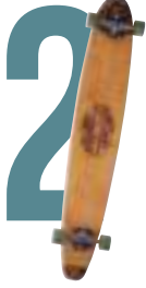
Grande blu STYLE