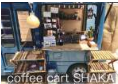
SHAKAのドリンクワゴンも来ます